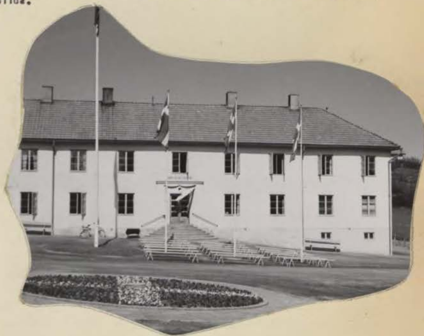
Brukskontoret i Gunnebo

Bruket ligger vackert vid Verkeböcksviken, en vik av Östersjön. Samhället har under senare år expanderat livligt. Sälunda har de gamla bruksbostäderna moderniserats och sanerats varjämte nya bostadsområden för egenhems- och hyreshusbebyggelse tillkommit. C:a 150 egenhem har uppförts med subventioner från såväl bolaget som kommunen. En kommunal bostadsstiftelse är som bäst i färd med att uppföra affärs- och bostadshus i Gunnebo Centrum, dit också kommunens administrationslokaler kommer att förläggas.