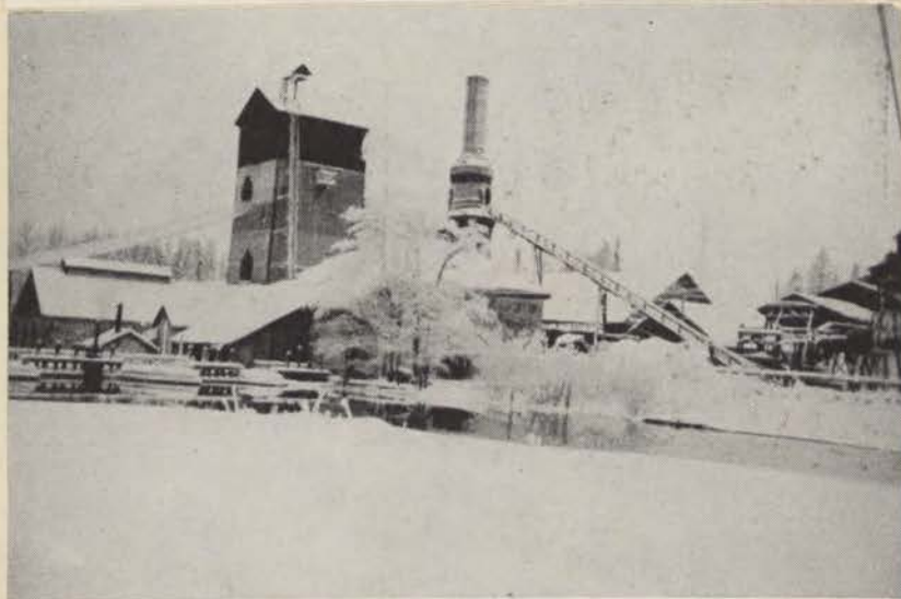
Hyttan i Sikfors.