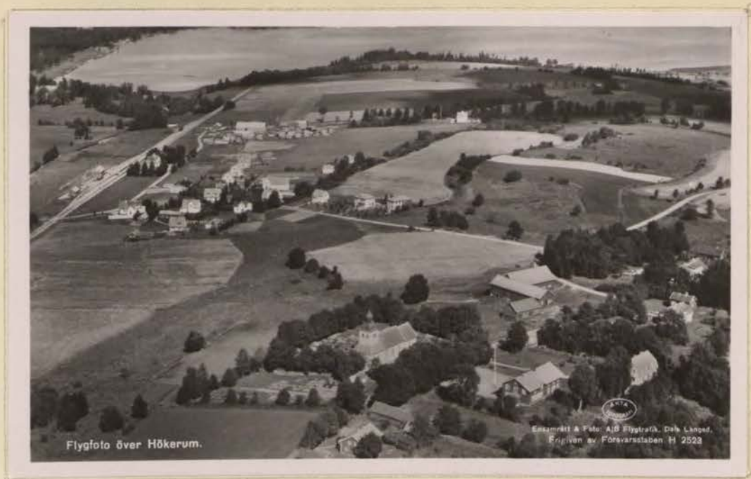
Hökerums stationssamhälle, centrum för stor- kommunen, som tidigare utgjorde tio små kommuner.