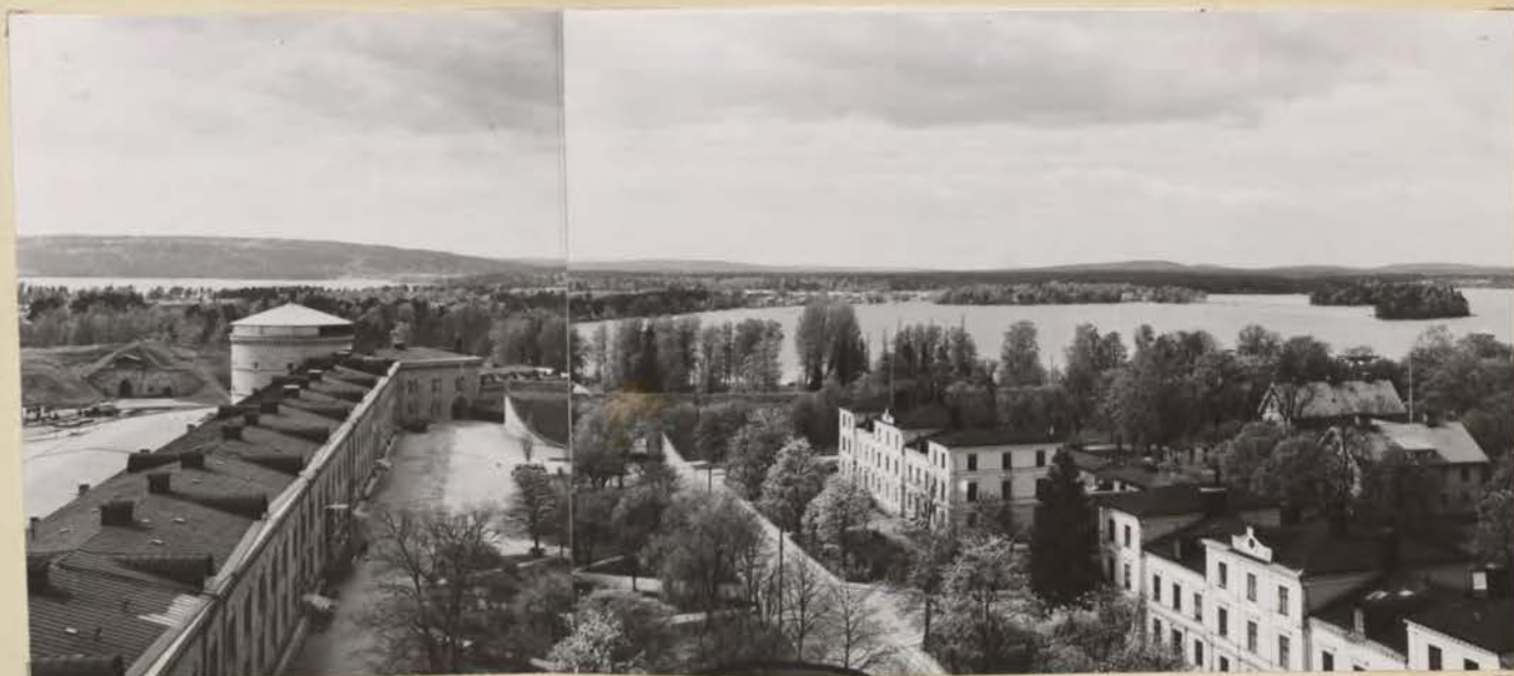
Utsikt över Karlsborg från garnisonskyrkan inom fästningsområdet. Till vänster Botten-sjön och Vaberget till höger Vättern.

"Götiska Valvet", huvudentrén till Karlsborgs fästning. (Blivande kommun- eller stadsvapen?) Grundstenen till fästningen lades år 1819 av Karl XIV Johan - efter förlusten av Finland- och år 1909 var huvudfästningen fullbordad. Ett stycke militär- och kulturhistoria samt en turistisk sevärdhet.