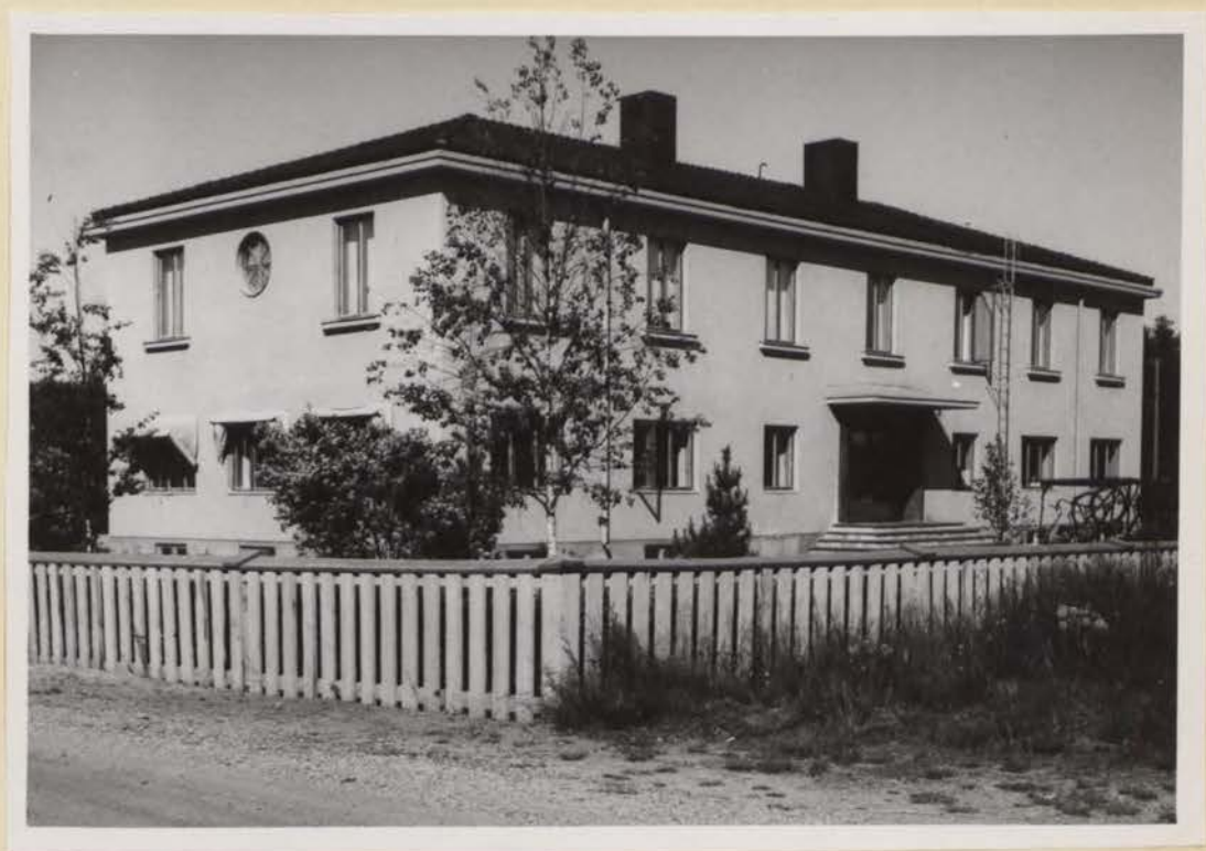
Lycksele landskommuns kommunalhus