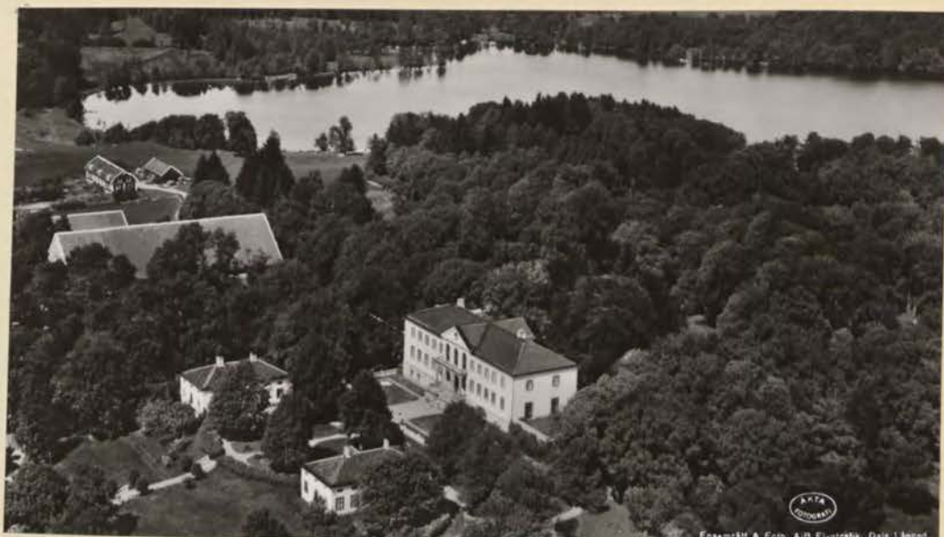
Näås Slott och Parken.