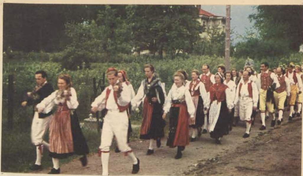
Näås, Floda. Midsommarfest.