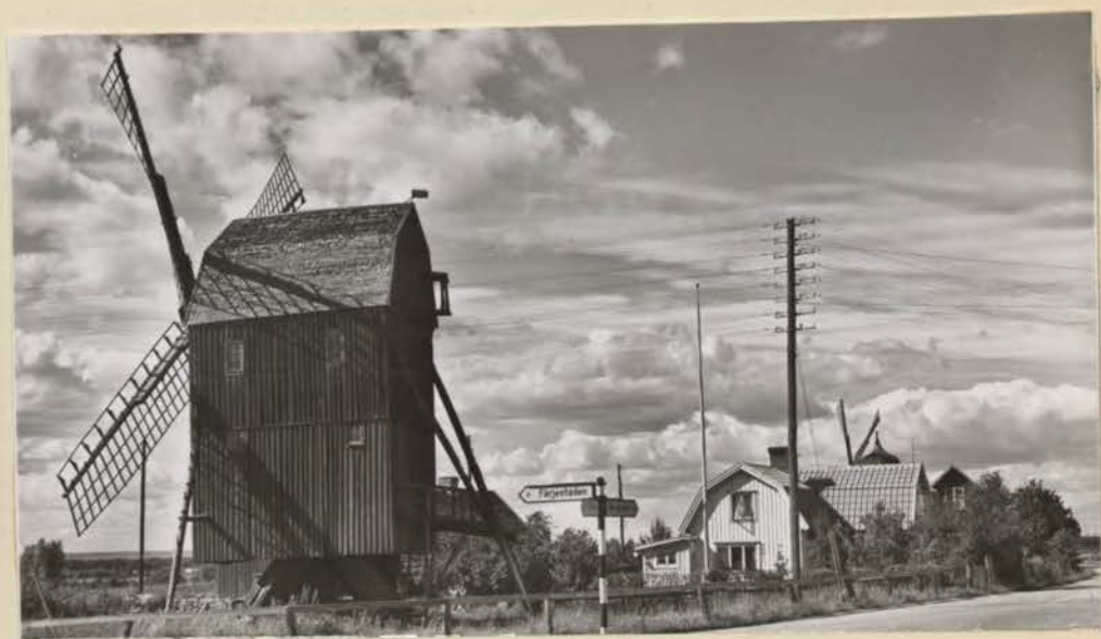
"Kvarnkungen" vid Färjestaden