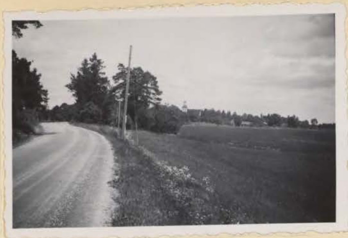
Kommunens förvaltningscentrum sett från Västeråsvägen från söder.