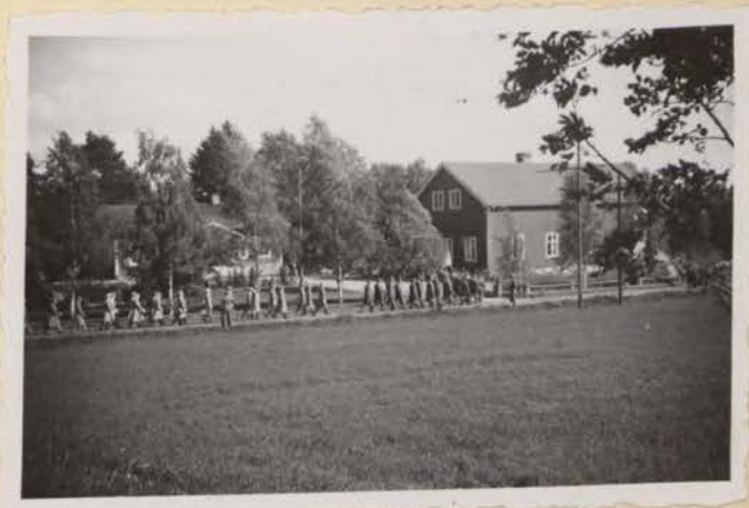
Hembygdsförsvaret på väg till Kommunalkontoret.